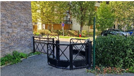
Rue César Franck

Comité de Quartier : Bilan de la solution 2024.